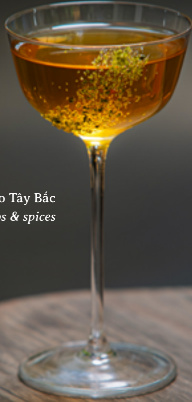
Chấm chéo Tây Bắc Tây Bắc herbs & spices

Mojito truyền thống ..... 210 Classic mojito