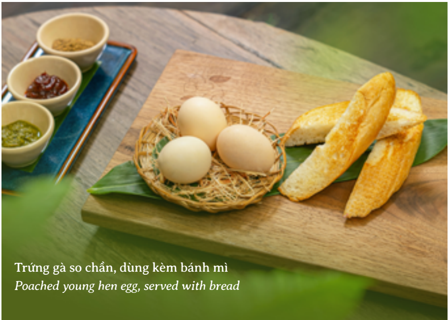
Trứng gà so chân, dùng kèm bánh mì Poached young hen egg, served with bread

Baked banana bread, served with sour cream, stewed fruits, and lime honey